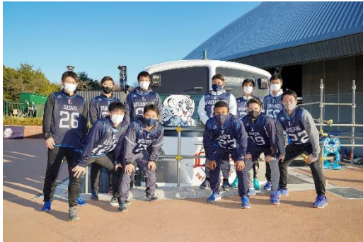
「L-train 101」の前で写真撮影に臨んだ 2021 年新人団選手