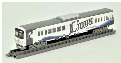
※写真は試作品です。